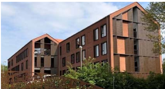
Det nye sundhedshus