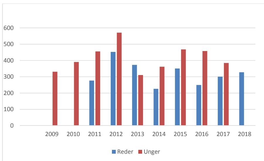
Figur 2: Udviklingen i niveauet af rågereder (blå) og totale antal regulerede rågeunger (rød) opgjort for alle kommunale arealer i Odder Kommune. Der foreligger ikke optællinger af rågereder fra før 2011.

Figuren nedenfor viser udviklingen i niveauet af antal rågereder og antal regulerede rågeunger på kommunale arealer.