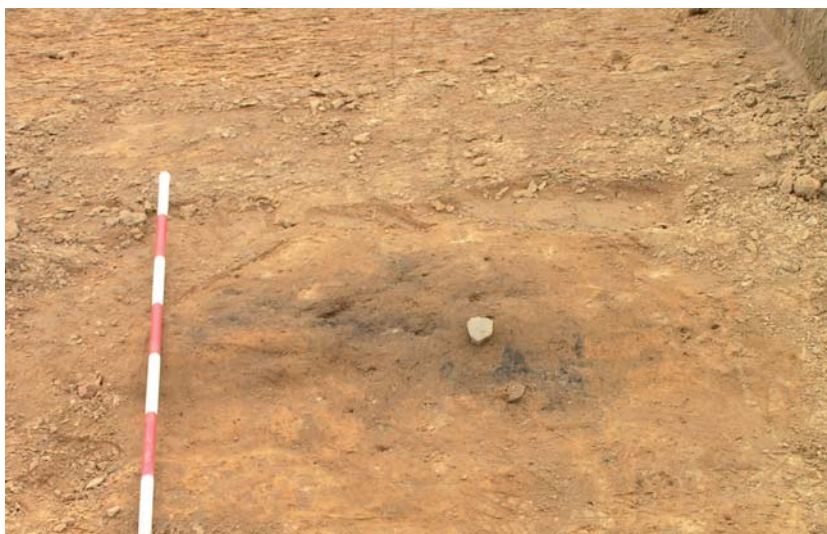
Fig.5. Sekundær jernalder urne i høj sb.6

Som før nævnt er der ved sognebeskrivelserne afsat tre høje (sb. 6, 7 og 8) både visuelt og udgravningsmæssigt må sb. 7 tolkes som værende afsat forkert. Ved prøvegravning af denne lokalitet sås der ingen spor af høj eller højning, derimod tolkes sb 6 som værende en tvillingehøj indeholdende både sb. 6 og sb. 7, koordinaten for sb. 7 skal derfor flyttes fra utm zone 32 ed 50: 569902/6204505 til 569885/6204476. Ved udgravningen af sb. 8, viste det sig, at der i historisk tid har været sandgravning i højen. Dette sås som dybe nedgravninger i den centrale del af højen, hvor en formodet centralgrav har været beliggende. Det er formodentlig i forbindelse med dette, at den ovenfor nævnte pilespids er fundet. Anlægget må anses for ødelagt og museet vurderer at den ikke har potentiale for videre udgravning. Prøvegravningen i høj sb 6 (og sb 7) afslørede tre gravanlæg. Det centrale anlæg i høj sb 6 bestod af et lyst gråbrunt anlæg med en indre kerne af mellembuntet let leret sand. Anlægget dateres skønsmæssigt til den sene del af bondestenalderen eller begyndelsen