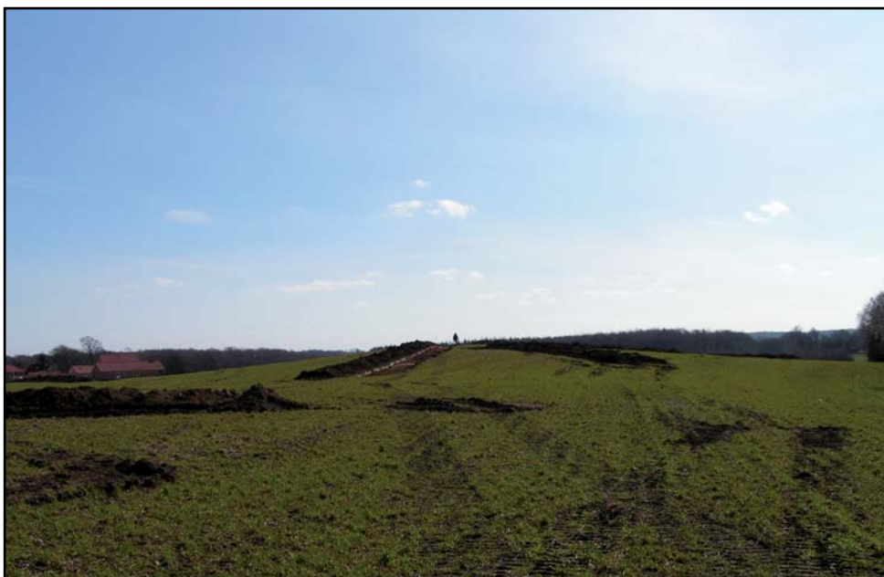
Fig. 3. Højene sb. 6 og sb.7 med prøvegrøfter

Der blev i alt trukket 32 grøfter samt gravet en sammenhængende flade. Mulden blev aftaget i tre meter brede grøfter af gravemaskine på larvefødder. Grøfterne var forløbende tilnærmelsesvis nord-syd. Ved de kendte overpløjede høje blev der trukket grøfter fra den formodede højfod op mod den centrale del af højen (fig.3). Dette med henblik