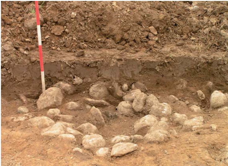
Fig. 6. Stensat grav i høj sb.7.

nen. Skulle dette ønske bortfalde og man i stedet ønsker området bebygget, skal højene arkæologisk undersøges.