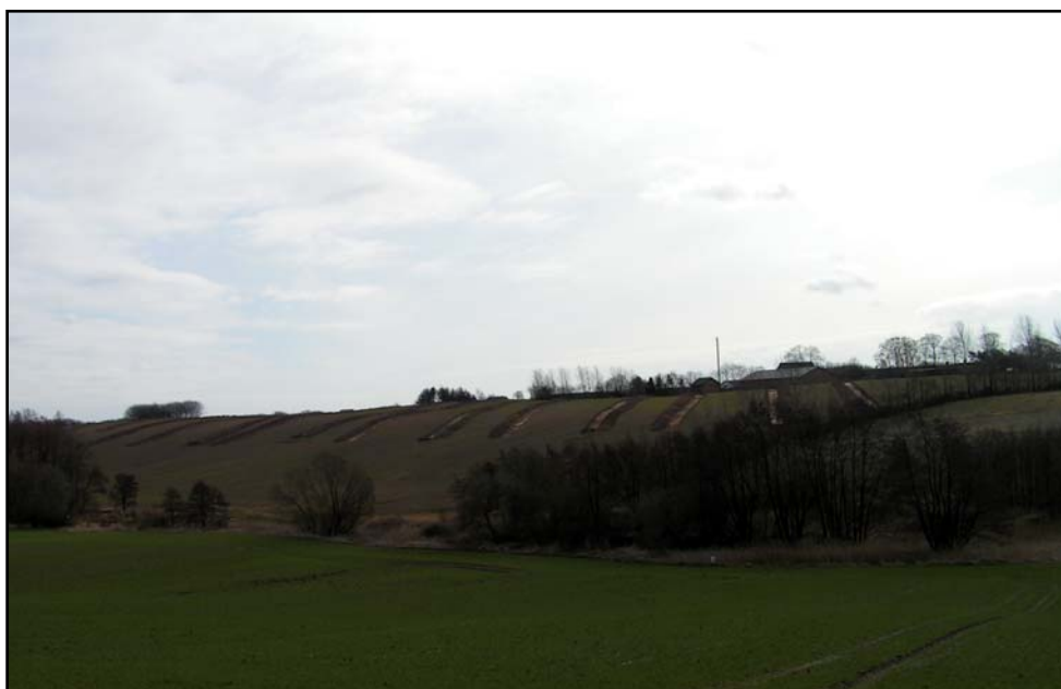
Fig. 2. Udgravningen set fra nord

Området er højt beliggende. Syd for Snærildgård falder mod vest og mod nord endog meget stærkt faldende mod Stampemøllebæk.(fig.2) Undergrunden består dels af fed moræneler dels af smeltevandssand