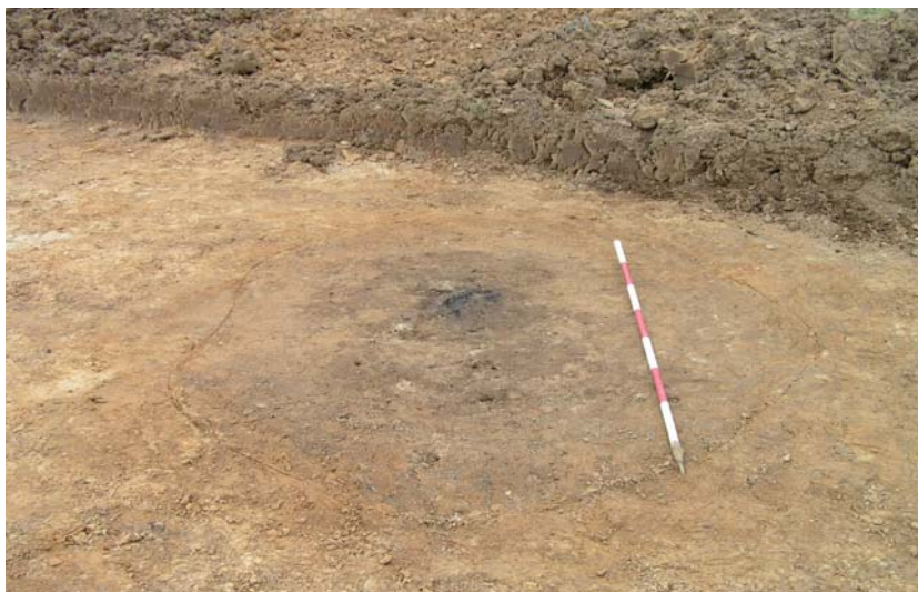
Fig.4. Centralgraven i høj sb.6.