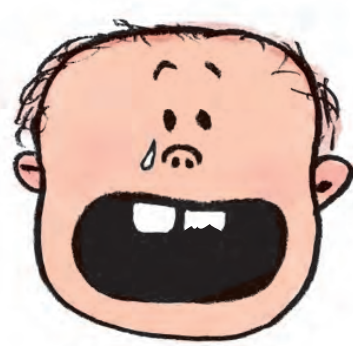
TANDEN ER LØS ELLER KNÆKKET

2: Kontakt tandlægen inden for de første par dage.