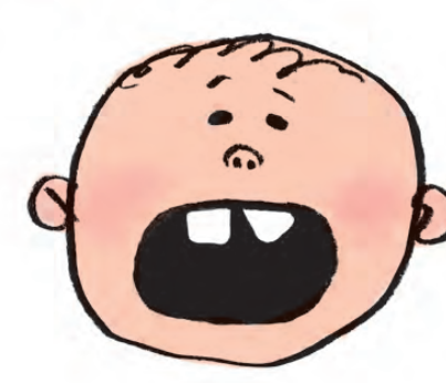
TANDEN ER SLÅET SKÆV BARNET KAN IKKE BIDE SAMMEN

1: Kontakt tandlægen inden for de første par dage.