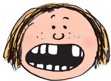
TANDEN ER SLÅET UD

1: Find tanden. Hold på tandens hvide del, så du ikke beskadiger roden.