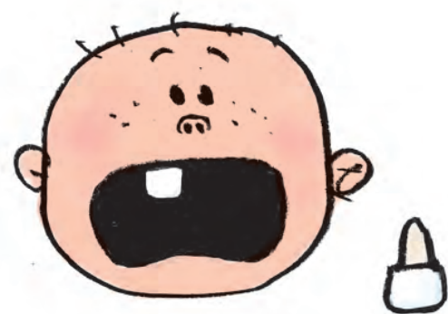
TANDEN ER SLÅET UD

1: Forsøg IKKE at sætte den på plads igen.