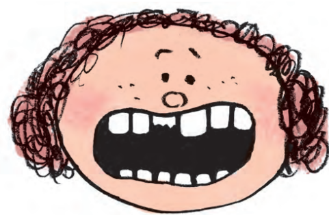
TANDEN ER KNÆKKET

3: Kontakt straks tandlægen eller tandlægevagten. Akut behandling er nødvendig.