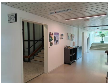
3. Drej til venstre for enden ad gangen, og tag trapperne eller elevatoren én etage op.