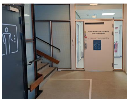
4. Drej til venstre og gå gennem døren til den kommunale tandpleje. Drej til venstre lige inden for døren.