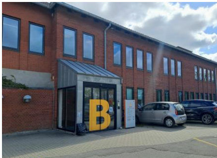
1. Indgang B ved Asylgade.