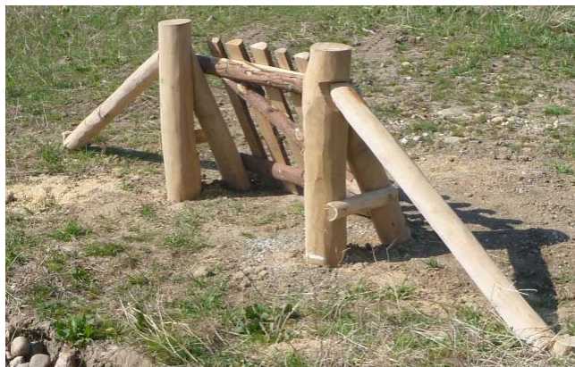
Figur 5: Faldlåger sikrer offentlighedens adgang til de indhegnede arealer

Rekreativt: I henhold til strukturplanen skal der sikres et passende antal cykel- og trædestier gennem området, der vil kunne forbinde boligområderne på begge sider af ådalen. Der skal som udgangspunkt være offentligt tilgængeligt i hele området. Dyrehegn skal etableres med et passende antal låger og led, således at arealer er tilgængelige fra de tilstødende stisystemer. I forbindelse med afgræsningen kan området periodisk være lukket for offentligheden.