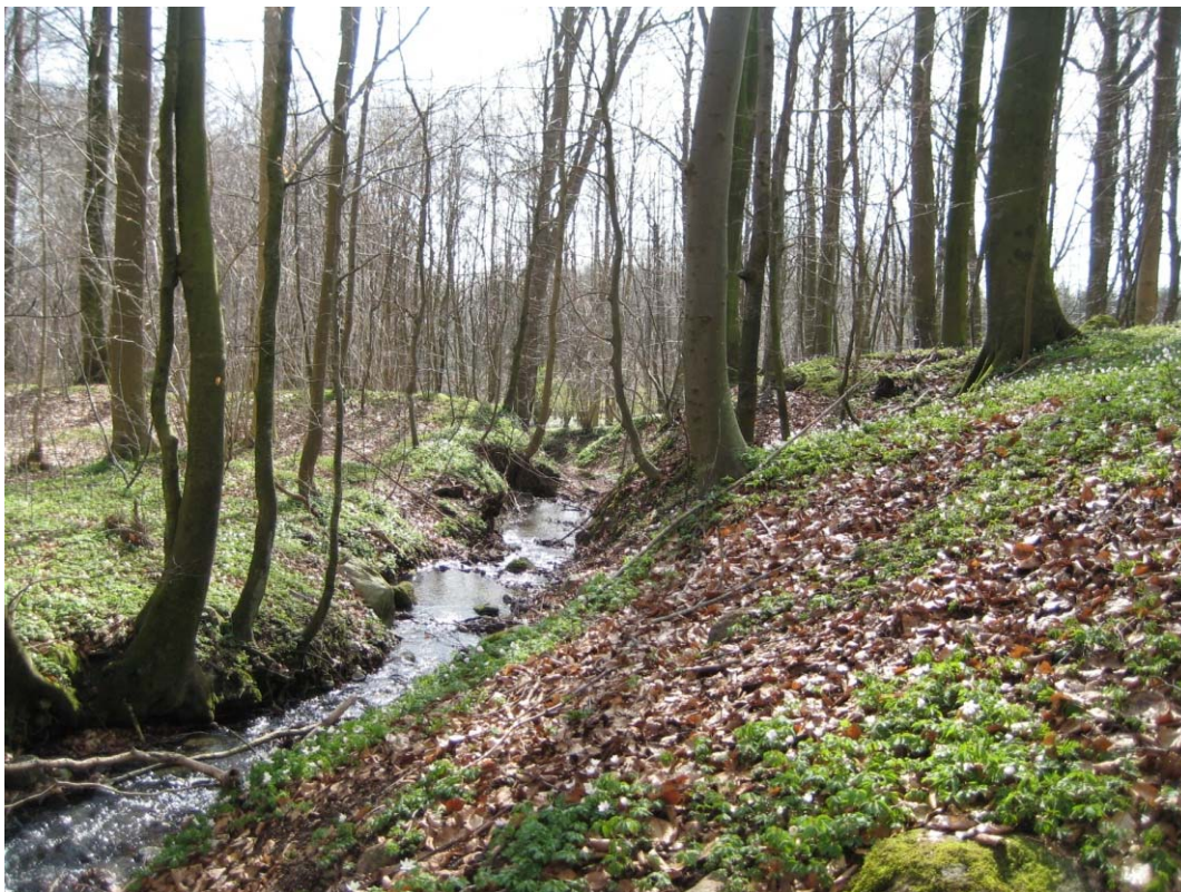
Figur 6: Balle bæk i Balle skov

I forbindelse med omlægning af monokulturen, vil der forekomme skovhugst og udvalgte stammer og stubbe vil blive efterladt til skovens nedbrydere.