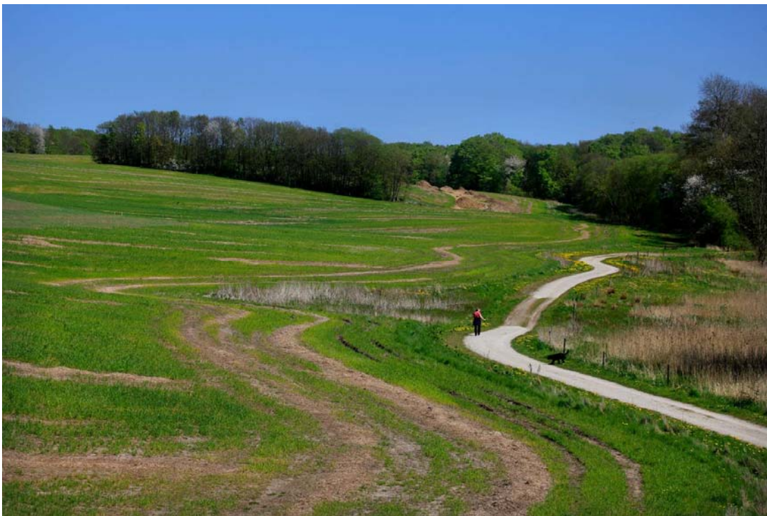
Figur 3: Delområde 2 før byggemodning, 2018.

Området er på ca. 13 ha og afgrænses mod vest af Snærildvej, mod syd af Stampemølle Bæks oprindelige vandløbstrance og mod øst af skovbrynet. Når byudviklingen er gennemført vil delområdet afgrænses af boligområder mod nord.