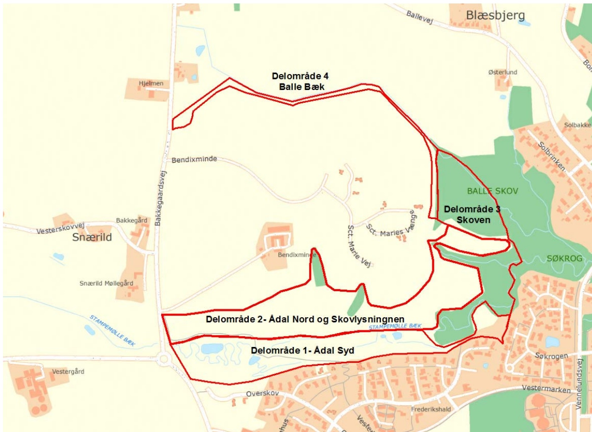
Figur 2 – Oversigtskort over rekreative områder i Odder Vest. Områderne er opdelt i fire delområder.

Delområderne afviger en smule fra kommuneplanrammerne 1 RE 7, 1 RE 8 og 1 RE 9, idet de er udvidet med mindre arealer, hvor kommunen er ansvarlig for driften, f.eks. de to skovbevoksede slugter i delområde 2. Plejeplanen omfatter ikke arealer nord for Balle Bæk.