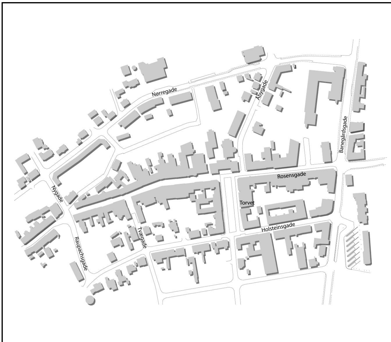
Kort over Odde Byrmitte